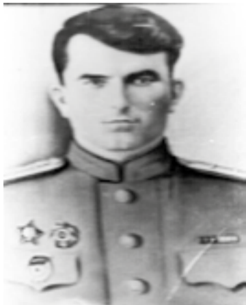
XI. Махлачев Унсоколо росо