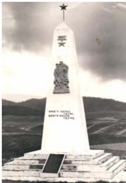
(Байбихъи араб номералда)

Рагъул тлоцесел къояздаса нахъего цакъго тлад кIвар къун гъабубеб буклана нухал къачай ва цийал нухал гъари. Кидагосеб хъаравулгъиялда гъоркъ буклана чезабун Чиркъатласа Унсоколобе ва гъенисан росабалгъе почта рехиялгъул хIалтИи.