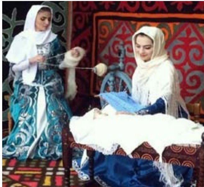
Талихл бугесда клоченаро эбелалгъул рахъдада цадахъ нилъее щвараб рахъдал маџ. Баркула глагараб рахъдал маџалгъул Къо!

РФялгъул Конституциялда абулел буго: «Щивасул ихтияр буго глагараблгъун бокъараб маџ тласа бищизе, тарбия лъай къеялгъул, творчествалгъул».