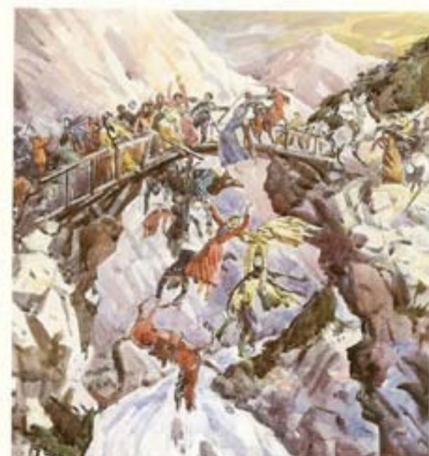
Хадусеб букIине буго

Граббел икъбал бергъараб сордо тIаде щвана. Рогъиналде гъужумалде хIадур рукIана гIурус аскариял. Къасиги гъес солдаталгун офицерзаби лъуна радал жиде-жидеца рагъ байбихъизе кколел бакIазда