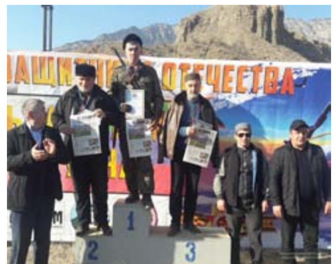
Сураталда: шапакъатал кьолел лахIазат

Ахиралда къецазда гIахъалгъаразе ва балагъизе рачIаразе баркала загьир гъабуна къецап гIуцIарал М-ХI. ХIажиевас