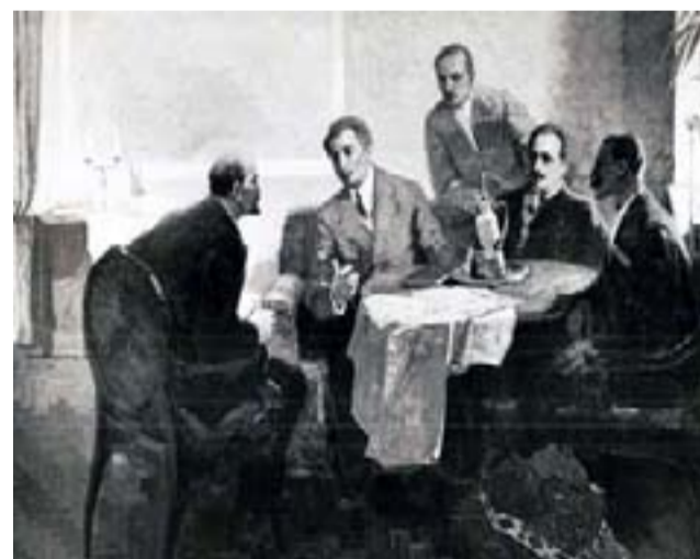
Тлахъал цалун толел гьечин, къулчлулел ругин.